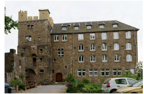
Burg Hohenscheid an der Wupper - Gründungsort des BDVT